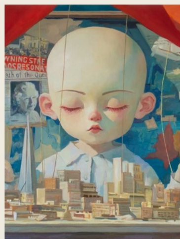
09 Nobody in Control 无人在控制