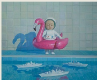
05 Nobody Plays Here 无人真正游玩