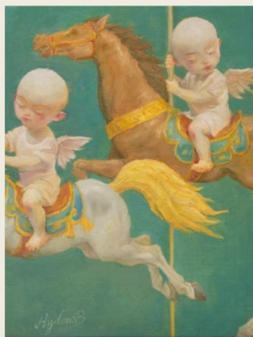
01 Repetition 永恒循环

Nobody first appears as a body, not as an id