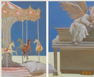
08 The Inherited Loop 被继承的循环