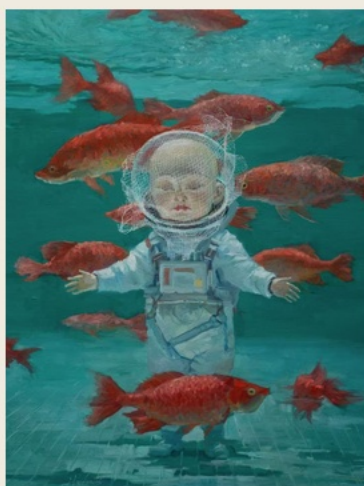
06 Out of Place 不在其所