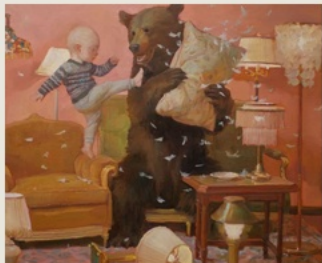
07 The Performed Self 被表演的自我