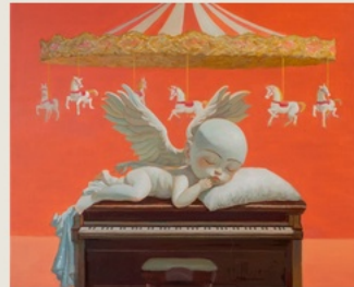
03 The Interval 间隙