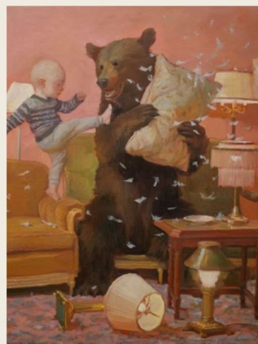
07 The Performed Self 被表演的自我