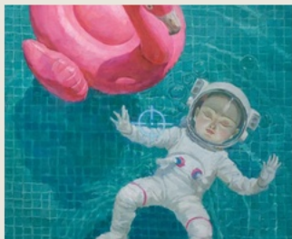
04 Nobody Is Watching 无人观看