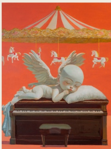
03 The Interval 间隙