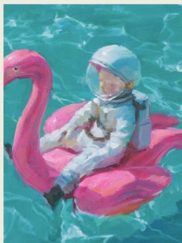
02 The Refusal to Sink 拒绝下沉

Nobody tests the world before understanding