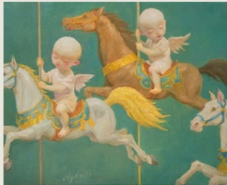
01 Repetition 永恒循环