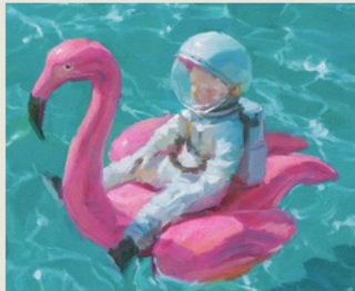
02 The Refusal to Sink 拒绝下沉