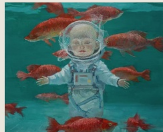
06 Out of Place 不在其所