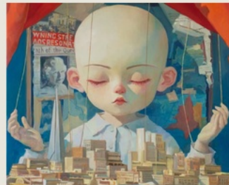
09 Nobody in Control 无人在控制