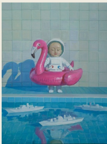
05 Nobody Plays Here 无人真正游玩