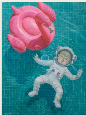
04 Nobody Is Watching 无人观看

Nobody is the state before becoming someone